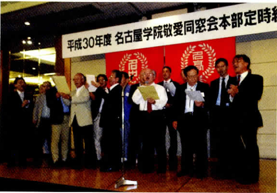
平成30年度名古屋学院敬愛同窓会本部定時総会