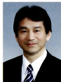
学校法人 名古屋学院学院長