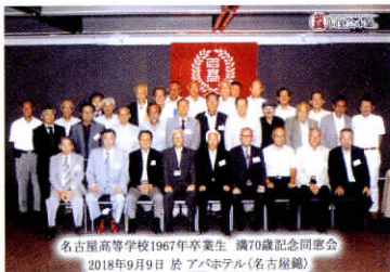
名古屋高等学校1967年卒業生 満70歳記念同窓会 2018年9月9日 於 アパホテル(名古屋錦)