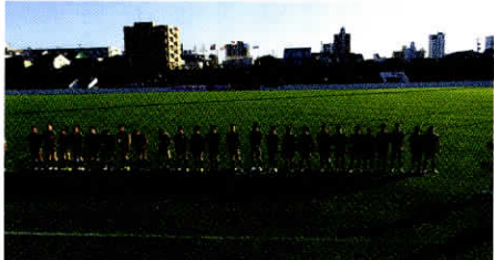
花園予選準優勝の名高ラグビー部

そして、OB諸兄におかれましては、ぜひともグラウンドへ足を運んでいただき、現役諸君へ激励やご指導をいただければと存じます。学生たちが「OBの皆様が名中名高ラグビー部のバトンを今日まで繋いでくれたからこそ、今がある」ということを自覚して、名中名高ラグビー部としての誇りを持つことが、「愛知県ナンバー1」という目標を達成するために不可欠であると考えます。今後とも名中名高ラグビー部をよろしく願っています。