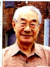
昭和29年 名古屋高校 卒業

昭和10年5月25日、名古屋市東区大曾根で出生 84歳 昭和29年3月、名古屋学院高等学校卒業。 愛知学芸大学卒業、尾張旭市で教職に就く。当市で38年間勤務。 退職後、愛知文教大学、名古屋女子大学非常勤講師。 中日文化センター講師。 前日本ボールペン画協会会長。 2002年から中日新聞愛知県版に「街道を行く」(絵と文・俳句)を掲載中。