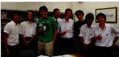
留学生当時の様子