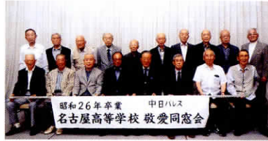
中日パレス 昭和26年卒業 名古屋高等学校 敬愛同窓会