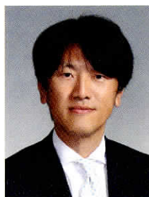
名古屋中学校・ 高等学校校長